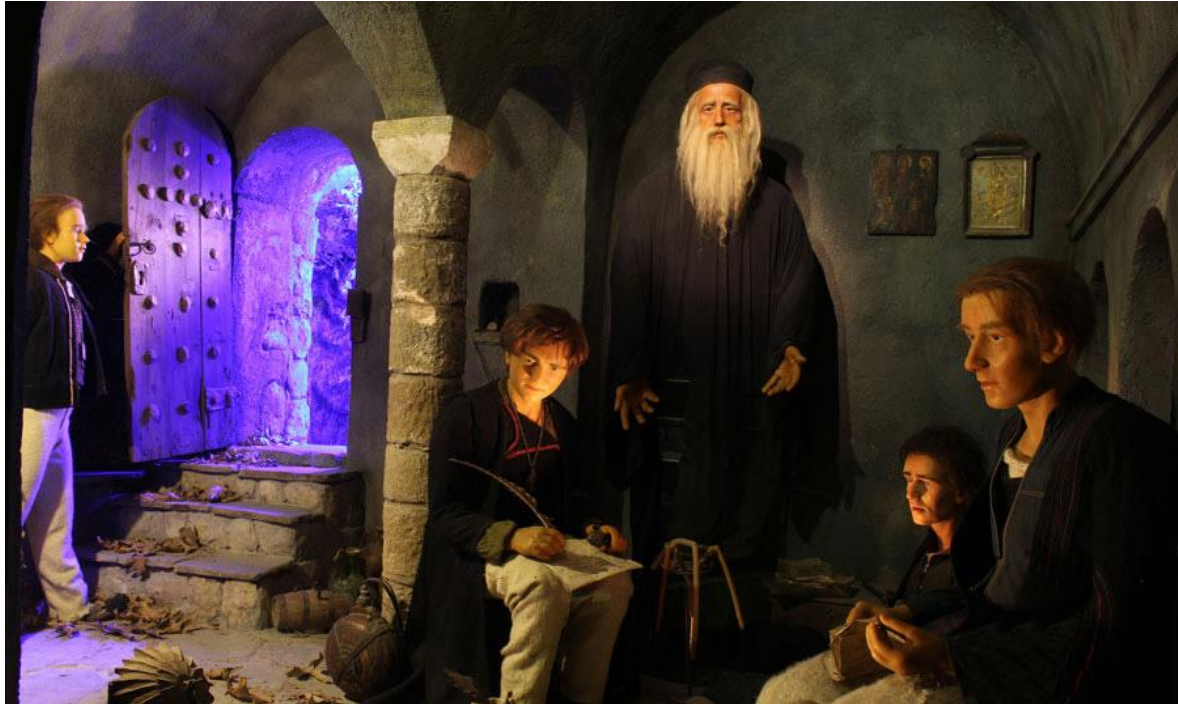
Το Κρυφό Σχολειό. [CC BY-SA 3.0 (Δημιουργήθηκε: Μουσείο Βρέλλη)]

Σκοπός του καλλιτέχνη ήταν να αναπαραστήσει ιστορικά γεγονότα από διάφορες περιοχές της Ελλάδας σε φυσικό μέγεθος μέσα στο μουσείο. Έτσι θα μπορούσε να παρουσιάσει τους ήρωες και τον ρόλο που διαδραμάτισαν, στους αντίστοιχους χώρους. Με δικές του ιδέες, μελέτες και πολλή προσωπική εργασία, έφτιαξε χώρους και ανθρώπους, για να βοηθήσει τον θεατή να βιώσει γεγονότα του παρελθόντος. Το Μουσείο φιλοξενεί περίπου 150 κέρνα ομοιώματα και 36 ιστορικά θέματα εμπνευσμένα από σημαντικά γεγονότα της Ελληνικής Ιστορίας.