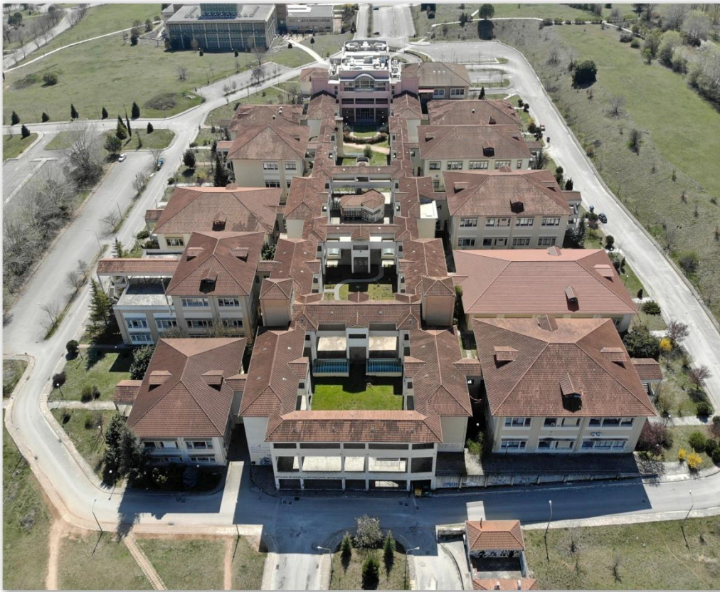
Κτηριακές Εγκαταστάσεις του Τμήματος Ιατρικής