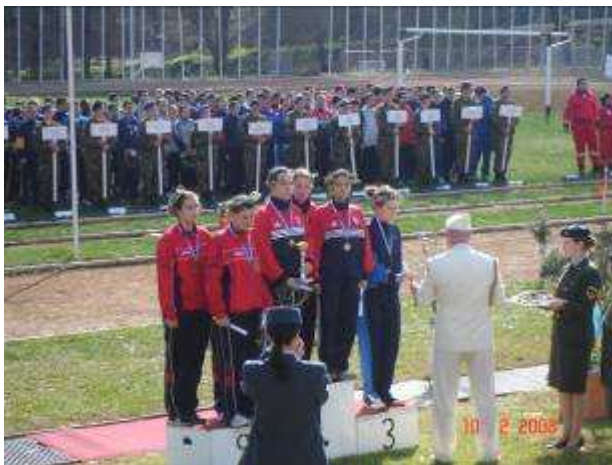
Εικ.48: Αγώνες Στρατιωτικών Σχολών