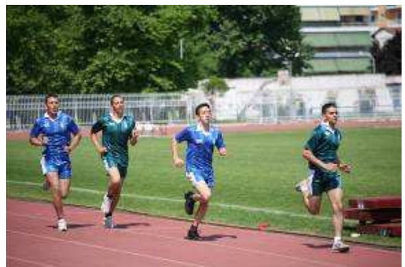
Εικ.55: Δρόμος 1600μ.