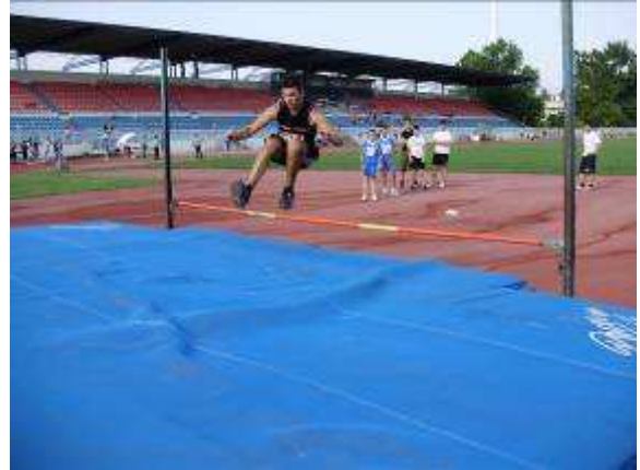
Εικ. 11: : Αθλητική Δοκιμασία-Άλμασε ύψος