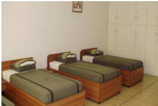
Εικ.78: Κτήρια Διαβίωσης Σπουδαστών