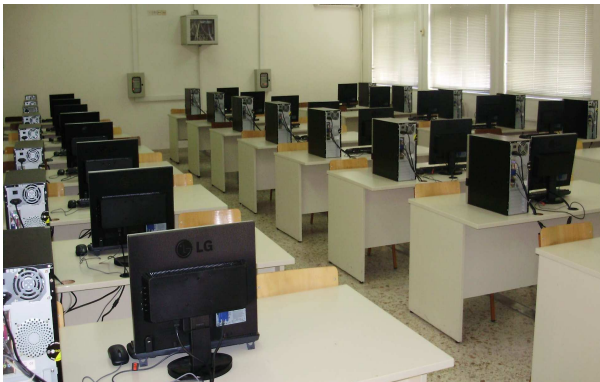
Εικ.86: Αίθουσα Πληροφορικής