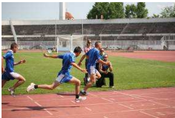
Εικ.54: Δρόμος 100μ.