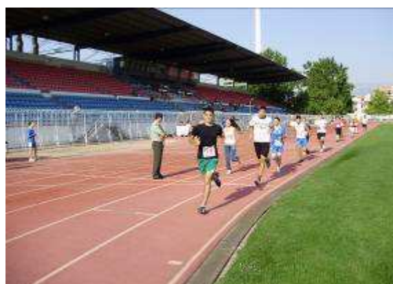
Εικ.9: : Αθλητική Δοκιμασία-Δρόμος 1000μ