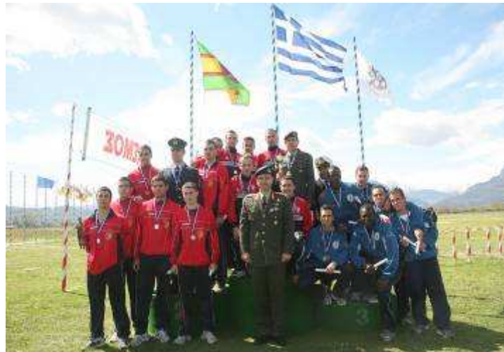
Εικ.47: Αγώνες Στρατιωτικών Σχολών

Οι αντιπροσωπευτικές ομάδες της Σχολής αγωνίζονται με τις αντίστοιχες ομάδες των Ανωτέρων Στρατιωτικών Σχολών Υπαξιωματικών(ΑΣΣΥ) του Ναυτικού, της Αεροπορίας και της Αστυνομίας στα πλαίσια των αγώνων των Ενόπλων Δυνάμεων και Σωμάτων Ασφαλείας που διοργανώνει το ΑΣΑΕΔ.