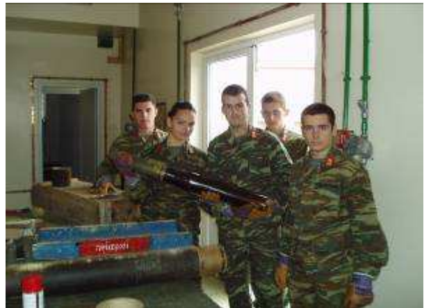
Εικ.29: Στρατιωτικό Εργοστάσιο

Στην Τεχνική εκπαίδευση εντάσσονται και τα παρακάτω μαθήματα: