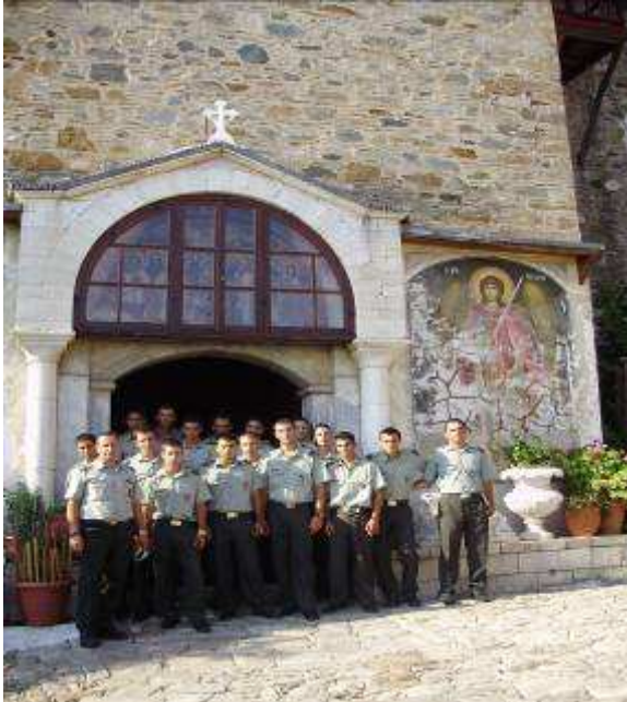
Εικ.72: Αγιο Όρος

Επίσης πραγματοποιούν εκπαιδευτικά ταξίδια στις περιοχές Ηπείρου, Μακεδονίας, Θράκης και στις Μονές του Αγ. Όρους.