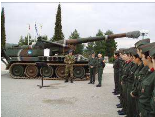
Εικ.70: ΚΕΠΒ, Θήβα