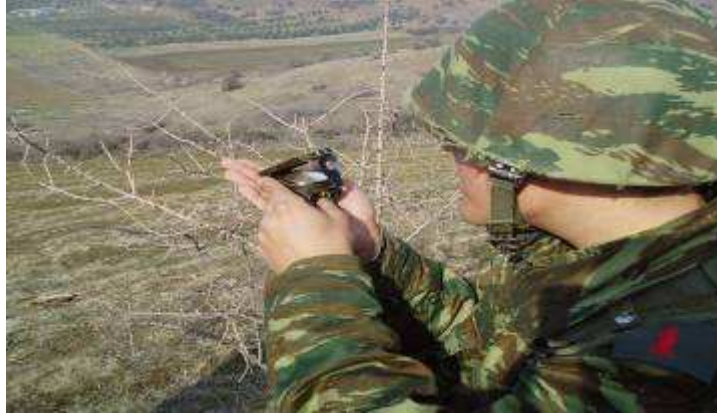
Εικ.35: Στρατιωτική Εκπαίδευση - Χρήση Πυξίδας.