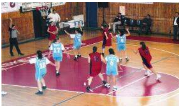
Εικ. 43: Ομάδα Καλαθοσφαίρισης