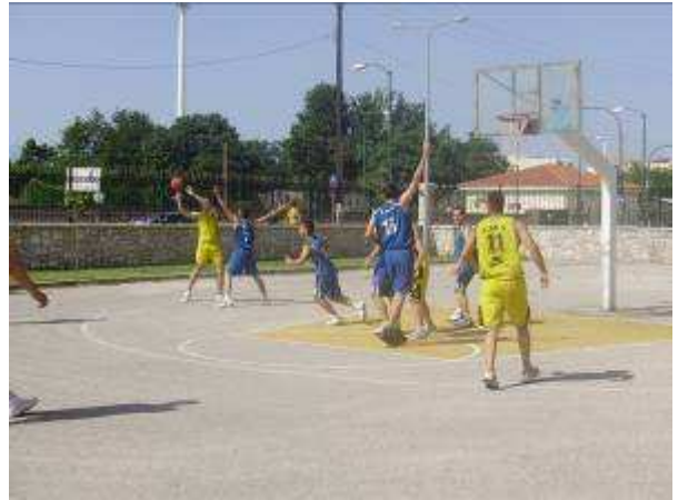
Εικ.85: Γήπεδο Καλαθόσφαιρας