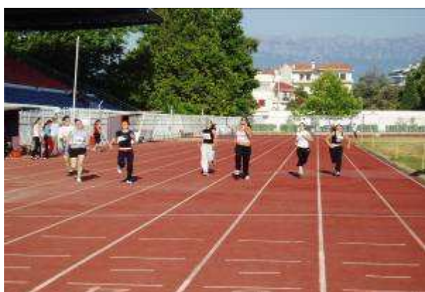
Εικ.8: : Αθλητική Δοκιμασία-Δρόμος 100μ