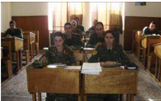
Εικ. 18: Αίθουσα Διδασκαλίας