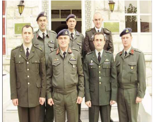
Εικ.103 Επίσκεψη Σχολής Γεωργίας

Στην ιστοσελίδα της ΣΜΥ, www.smy.gr , υπάρχουν όλες οι πληροφορίες για την ΣΜΥ.