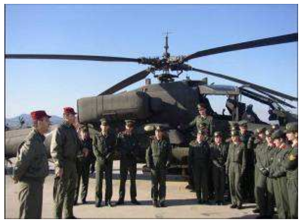
Εικ.71: 1 ο ΤΑΞΑΣ, Στεφανοβίκαιο