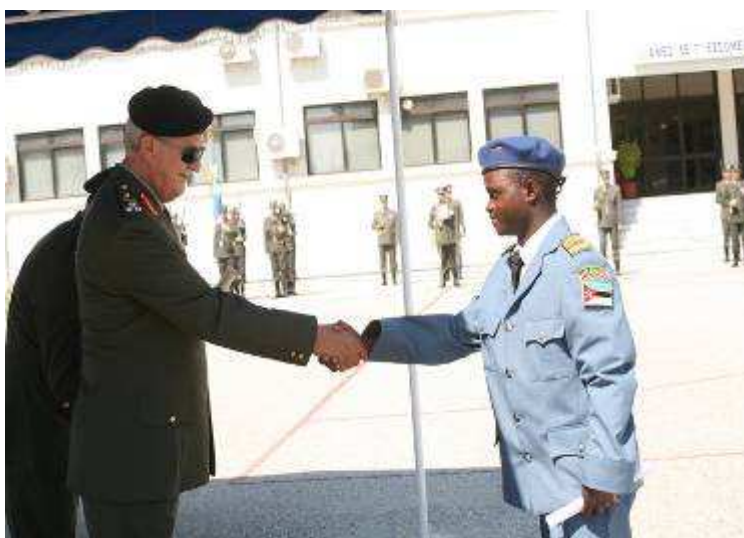
Εικ. 16: Αλλοδαποι Σπουδαστές

Τέλος, στην Σχολή εισάγεται και εκπαιδεύεται αριθμός Ελληνοκυπρίων Σπουδαστών καθώς και αλλοδαπών κατόπιν διακρατικών συμφωνιών.