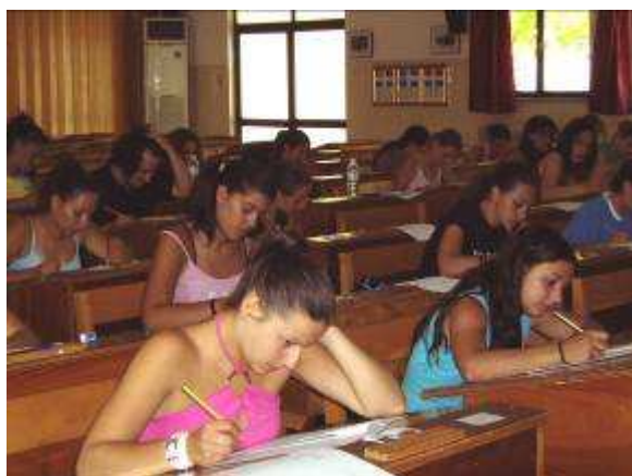
Εικ.6: Ψυχοτεχνική Δοκιμασία