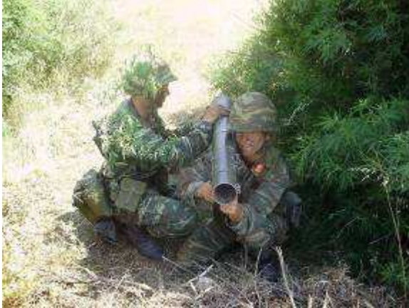
Εικ.30: Στρατιωτική Εκπαίδευση