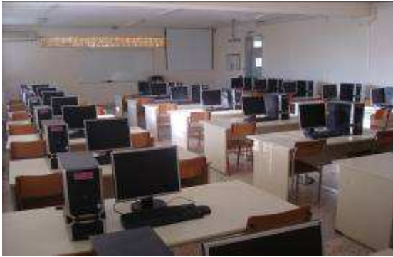
Εικ.89: Αίθουσα Πληροφορικής

Για τη ψυχαγωγία των Σπουδαστών διατίθενται αίθουσες όπου μπορούν τις ελεύθερες ώρες να παρακολουθούν τηλεόραση και βίντεο, να ακούν μουσική και να χρησιμοποιούν Η/Υ με δυνατότητα περιήγησης στο διαδίκτυο.