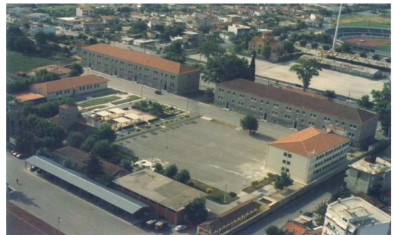
Εικ.75: Στρατοπέδο «Καβράκου»

Στις εγκαταστάσεις του στρατοπέδου, ένα συνδυασμό παλαιών και νεότευκτων κτηρίων, περιλαμβάνονται εκτός των άλλων, κτήρια διαβίωσης των Σπουδαστών, αίθουσες εκπαίδευσης (των 20 ατόμων), 2 κέντρα ψυχαγωγίας Σπουδαστών, κλειστό γυμναστήριο, 2 αίθουσες βαρών, αθλητικές εγκαταστάσεις.