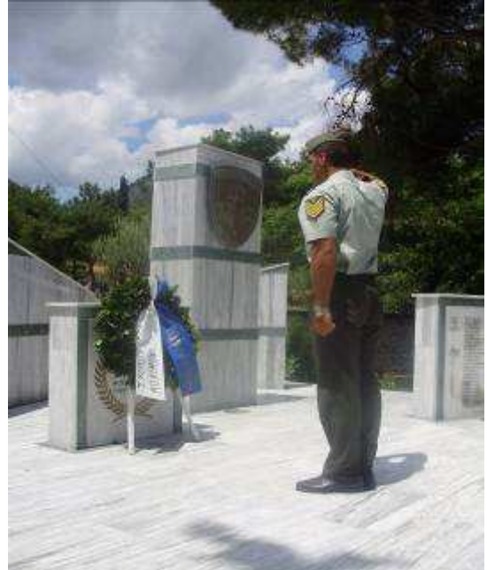
Εικ.73: Επίσκεψη στη Θράκη