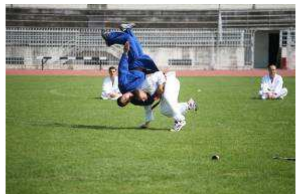
Εικ.61: Πολεμικές Τέχνες