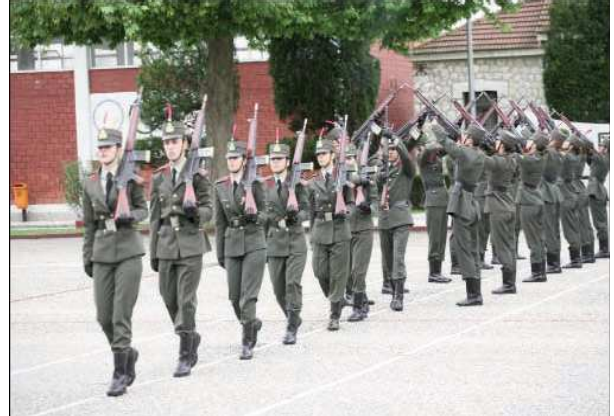
Εικ.99: Διμοιρία Επιδείξεων