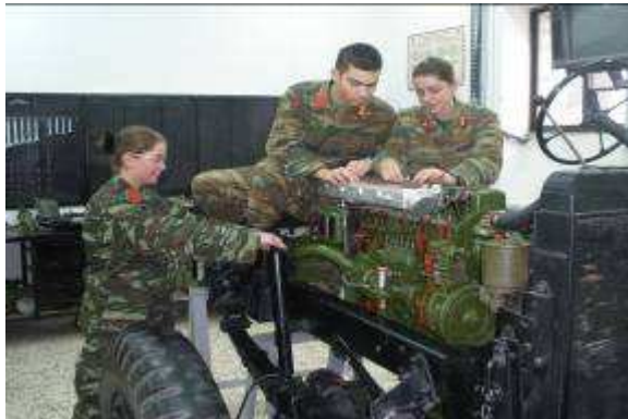
Εικ.21: Εργαστήριο Εσωτερικής Καύσης

Διεξάγεται στα εργαστήρια Μηχανών Εσωτερικής Καύσης, Ηλεκτρολογίας - Ηλεκτρονικών, Μηχανών Ελικοπτέρων, Μηχανουργικής Τεχνολογίας και Αντοχής Υλικών και σε εγγύς Στρατιωτικά Εργοστάσια.