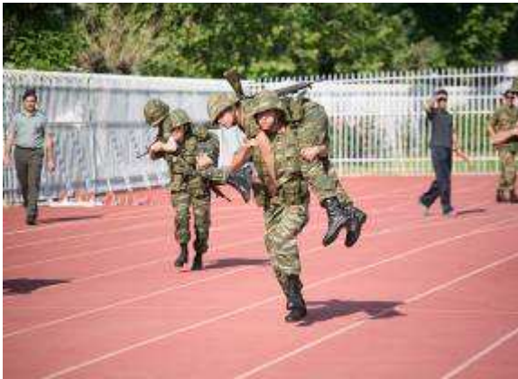
Εικ.52: Μεταφορά Τραυματία