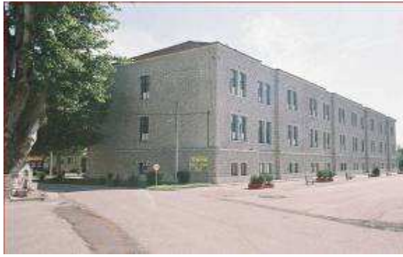
Εικ.76: Κτήρια Διαβίωσης Σπουδαστών