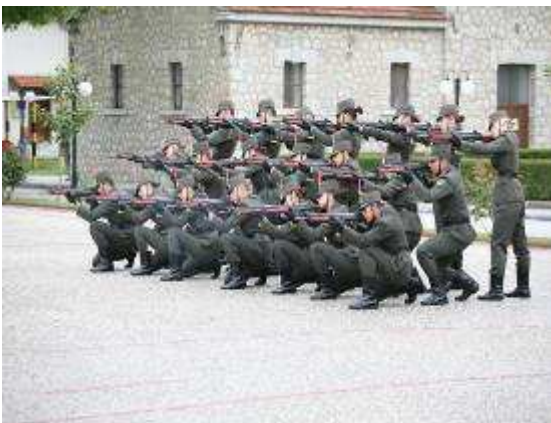
Εικ.100 Διμοιρία Επιδείξεων