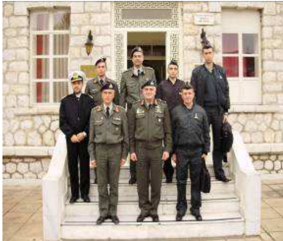
Εικ.102 Επίσκεψη Σχολής Σερβίας

Στα πλαίσια των διακρατικών συμφωνιών η Σχολή δέχεται, αλλά και ανταποδίδει επισκέψεις, αντιπροσωπίες Αξιωματικών από ξένα κράτη, με σκοπό την ενημέρωση αλλά και την ανταλλαγή απόψεων σε θέματα που αφορούν τις Στρατιωτικές Σχολές γενικά.