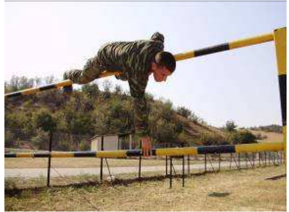
Εικ.51: Διέλευση Στίβου Εμποδίων