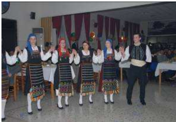
Εικ.58: Παραδοσιακοί Χοροί