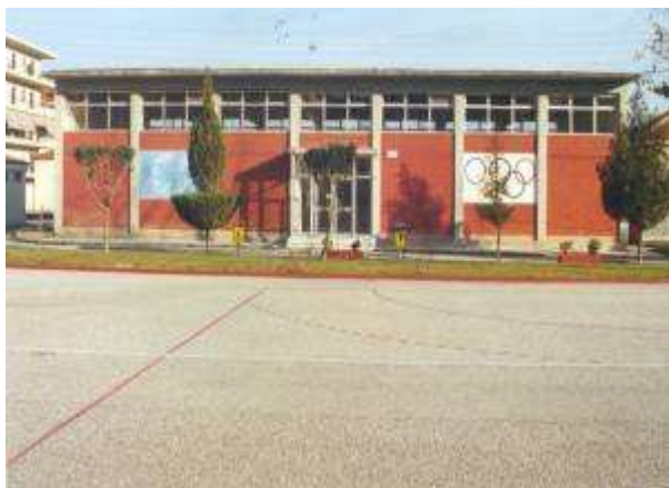
Εικ.82: Κλειστό Γυμναστήριο