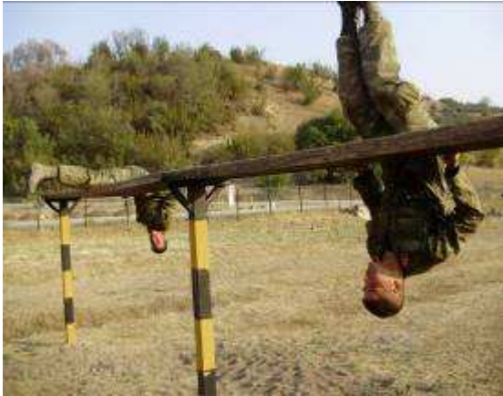
Εικ.50: Διέλευση Στίβου Εμποδίων