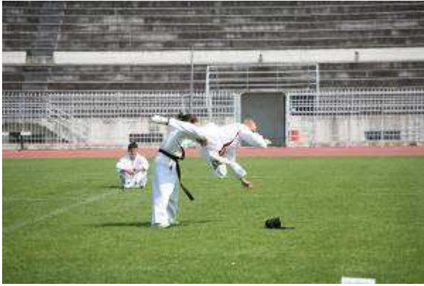
Εικ.45: Ομάδα Πολεμικών Τεχνών