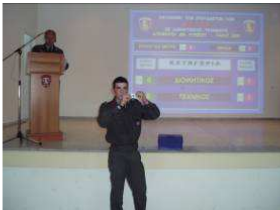
Εικ. 14: Διαδικασία Κατανομής

Οι Διοικητικοί μετά την ολοκλήρωση του 2 ου έτους κατανέμονται, ως Μόνιμοι Λοχίες, στα Όπλα (Πεζικό, Τεθωρακισμένα, Πυροβολικό, Μηχανικό, Διαβιβάσεις, Αεροπορία Στρατού, Φροντιστές) ή Σώματα (Υλικού Πολέμου, Εφοδιασμού Μεταφορών, Τεχνικού, Υγειονομικού, Έρευνας Πληροφορικής, Ταχυδρομικού, Στρατιωτικών Γραμματέων, Γεωγραφικού, Φροντιστών).