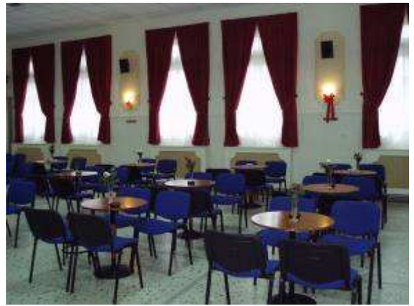
Εικ.81: Αίθουσα Ψυχαγωγίας