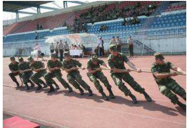
Εικ.53: Αγώνας Διελκυστίδας