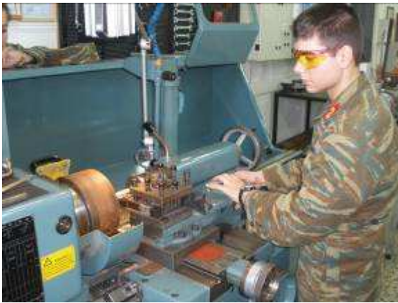
Εικ.28: Εργαστήριο Αντοχής Υλικών