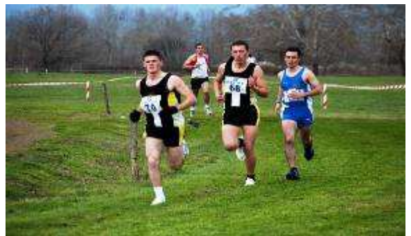
Εικ. 44: Ομάδα Κλασικού Αθλητισμού