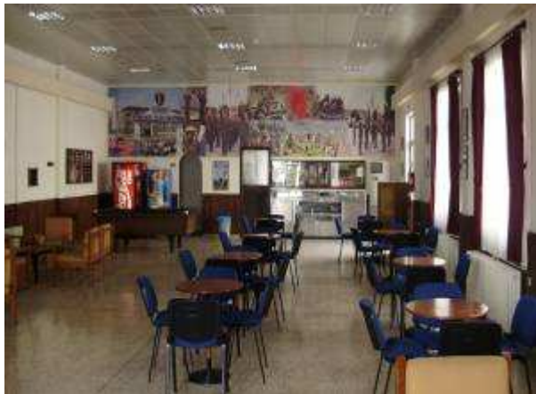
Εικ.80: Αίθουσα Ψυχαγωγίας