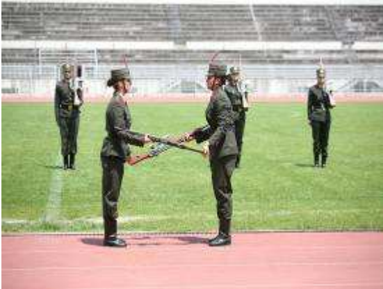
Εικ.98: Διμοιρία Επιδείξεων