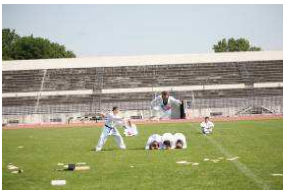
Εικ.60: Πολεμικές Τέχνες