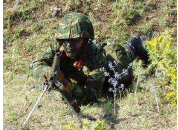
Εικ.31: Στρατιωτική Εκπαίδευση

Ειδικότερα αποσκοπεί στην ομαλή προσαρμογή των Σπουδαστών στη στρατιωτική ζωή, την αύξηση της φυσικής αντοχής και της σωματικής ενδυνάμωσης, την εκμάθηση χειρισμού ατομικού οπλισμού και εκτέλεση βολών με ελαφρά και βαρέα όπλα στην συμμετοχή σε πορείες, ασκήσεις κλπ.