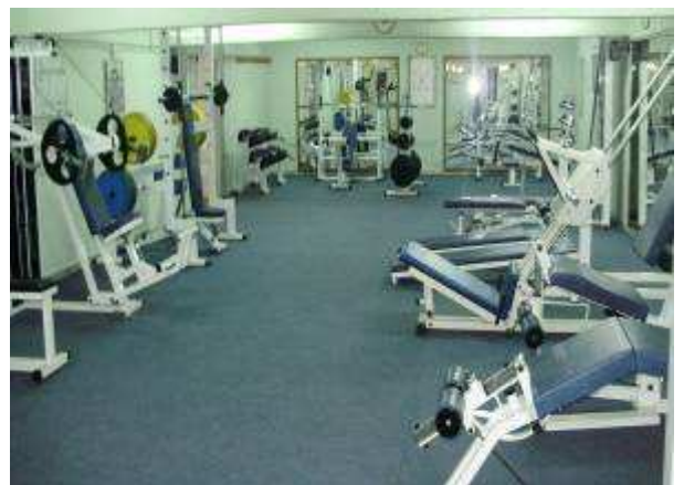
Εικ.83: Αίθουσα Βαρών