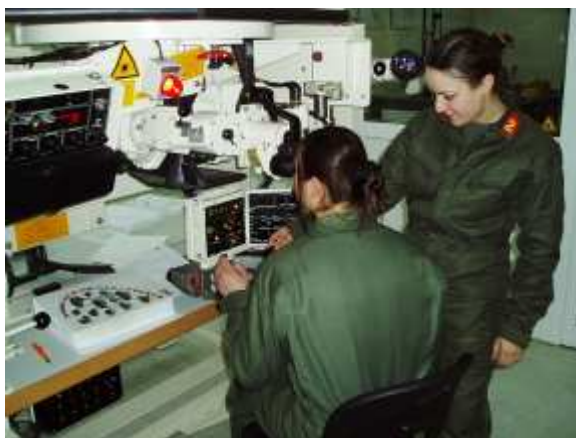
Εικ.24: Εργαστήριο Ηλεκτρονικών