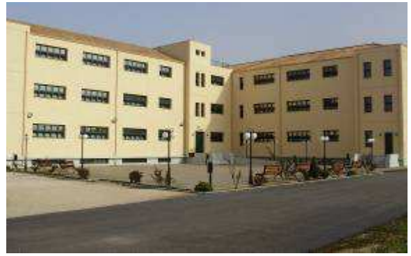
Εικ.77: Κτήρια Διαβίωσης Σπουδαστών