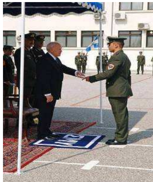
Εικ.95: Ονομασία Μονίμων Λοχιών