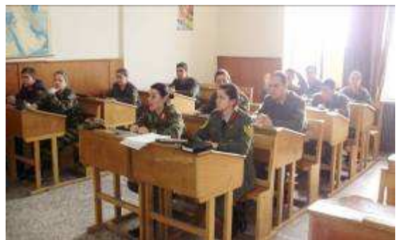
Εικ. 19: Αίθουσα Διδασκαλίας

Τα μαθήματα των Αγγλικών και της Πληροφορικής διδάσκονται σε όλα τα εξάμηνα εκπαίδευσης σε όλους τους Σπουδαστές.