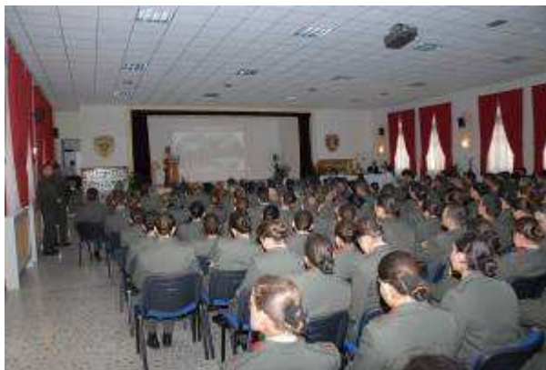
Εικ.91: Αίθουσα Εκδηλώσεων

Τέλος οργανώνονται από τους Σπουδαστές ορχήστρα, χορευτικά συγκροτήματα, θεατρικές παραστάσεις και χοροεσπερίδες.