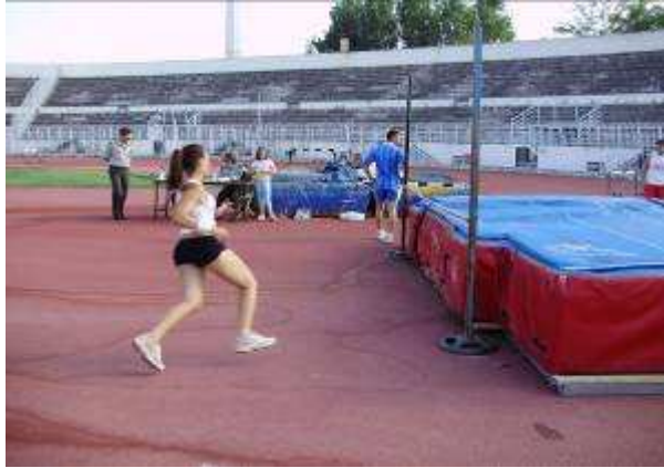
Εικ. 10: : Αθλητική Δοκιμασία-Άλμασε ύψος