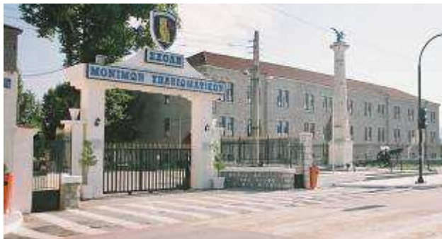
Εικ.74: Στρατοπέδο «Καβράκου»

Η Σχολή Μονίμων Υπαξιωματικών εδρεύει στο στρατόπεδο «ΚΑΒΡΑΚΟΥ» στα Τρίκαλα από το 1975.