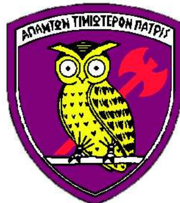
Εικ.5: Έμβλημα Σχολής

Απεικονίζει σύμπλεγμα κουκουβάγιας και διπλού πελέκεως και συμβολίζει τη μάθηση και τη γνώση (κουκουβάγια, σύμβολο των γραμμάτων και της σοφίας κατά την αρχαιότητα) καθώς και τη δύναμη – ισχύ (διπλός πέλεκυς, πολεμικό όπλο σύμβολο δύναμης). Στο πάνω μέρος του εμβλήματος υπάρχει το ρητό: «ΑΠΑΝΤΩΝ ΤΙΜΙΩΤΕΡΟΝ ΠΑΤΡΙΣ» (Η πατρίδα είναι το πολυτιμότερο αγαθό).