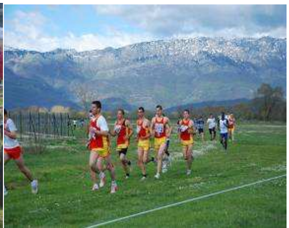
Εικ.49: Αγώνες Στρατιωτικών Σχολών

Η διδασκαλία της σωματικής αγωγής διεξάγεται σε όλα τα εξάμηνα και περιλαμβάνει τα αντικείμενα: