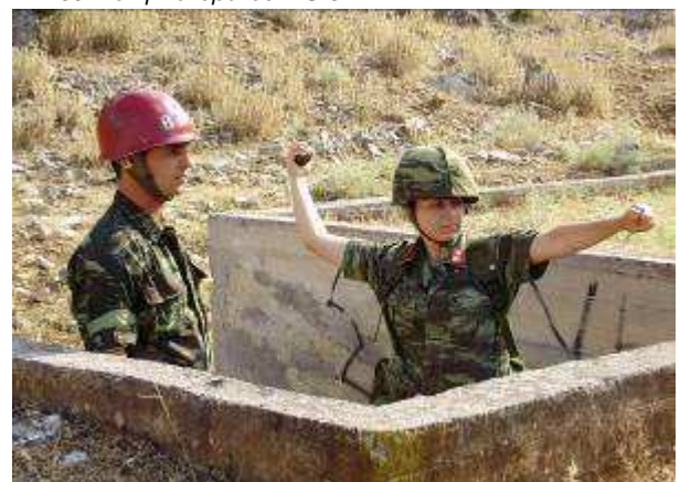
Εικ.34: Βολή Χειροβομβίδας

Στην στρατιωτική εκπαίδευση εντάσσονται και τα παρακάτω μαθήματα :