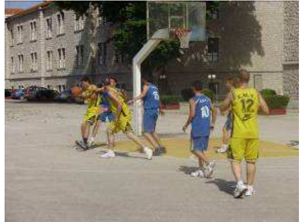
Εικ.57: Αγώνας Καλαθοσφαίρισης