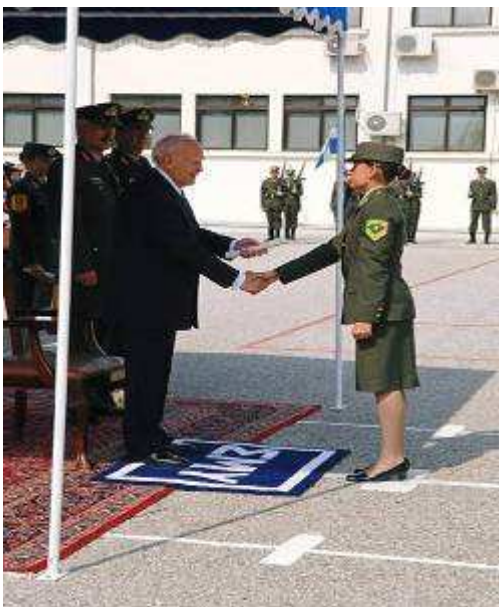
Εικ.94: Ονομασία Μονίμων Λοχιών