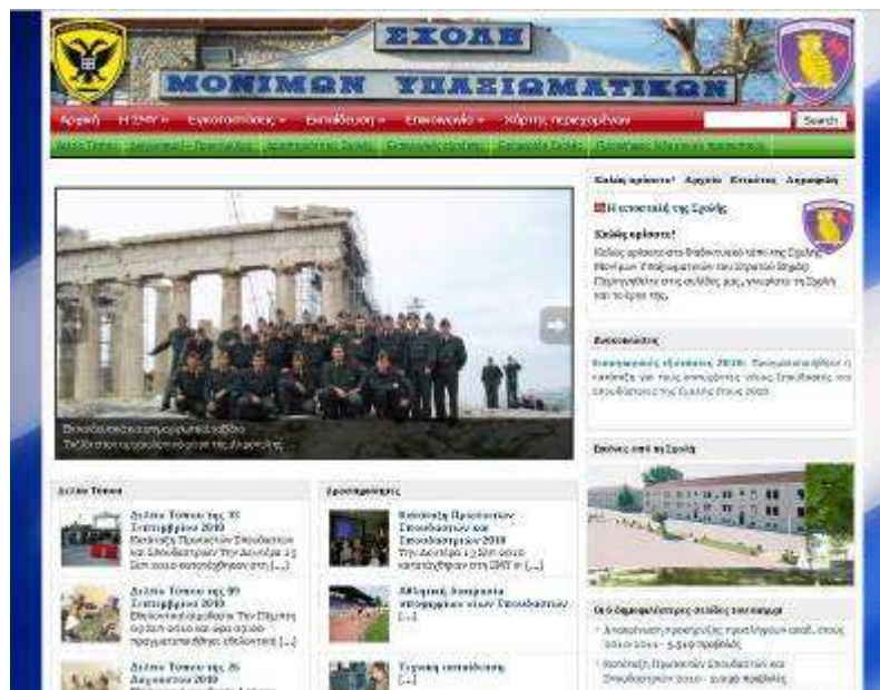
Εικ.104 Ιστοσελίδα της Σχολής

Στην ιστοσελίδα της ΣΜΥ, www.smy.gr , υπάρχουν όλες οι πληροφορίες για την ΣΜΥ.