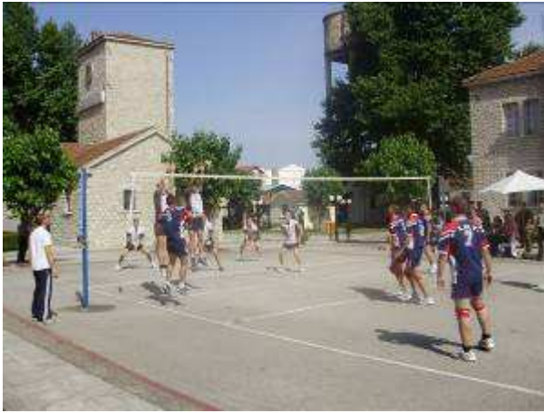
Εικ.84: Γήπεδο Πετόσφαιρας