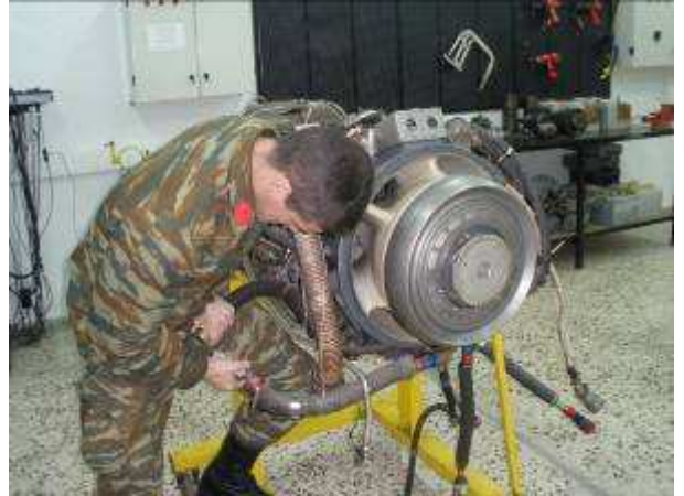
Εικ.27: Εργαστήριο Μηχανών Ε/Π