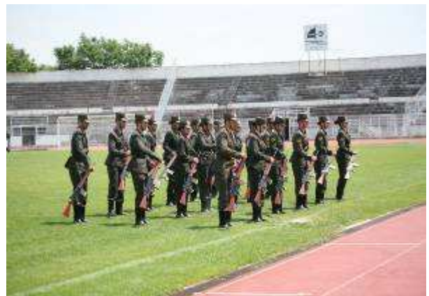
Εικ.101 Διμοιρία Επιδείξεων