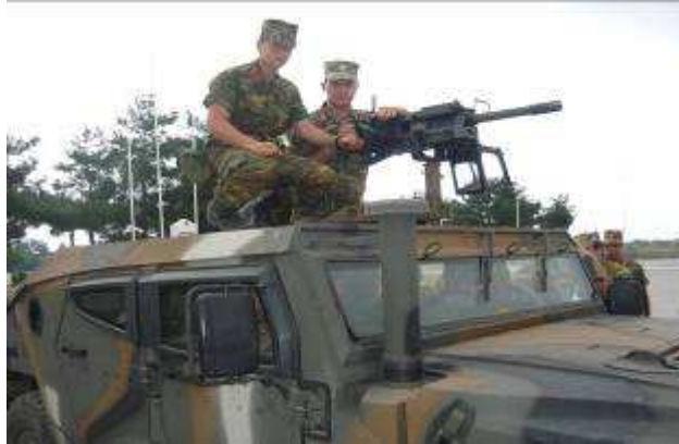
Εικ. 40: Π.Α.Λιτοχώρου