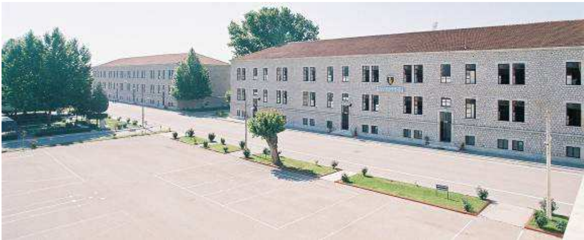
Εικ.88: Λιθόκτιστα Κτήρια της Σχολής

Αξίζει να σημειωθεί ότι τα λιθόκτιστα κτήρια του στρατοπέδου, που είναι πλήρως ανακαινισμένα και αποτελούν σημαντικό αρχιτεκτονικό και ιστορικό μνημείο για την πόλη των Τρικάλων, κτίστηκαν το 1910 τότε που ο Ελληνικός Στρατός προετοιμάζονταν για τους Βαλκανικούς πολέμους.