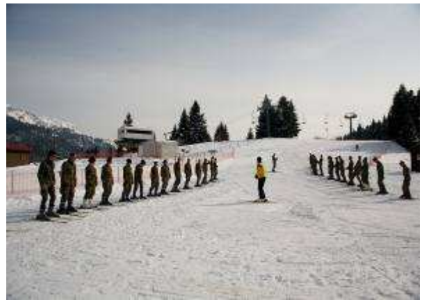
Εικ.37: Χειμερινή Διαβίωση

Η θερινή Στρατιωτική εκπαίδευση των Σπουδαστών της Σχολής είναι διαρκείας μέχρι 5 εβδομάδων και πραγματοποιείται, σε καταυλισμό στην περιοχή του Π.Β. Λιτόχωρου.