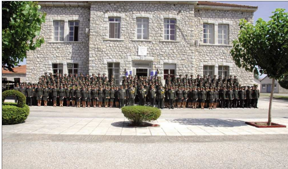
Εικ.93: Ονομασία Μονίμων Λοχιών

Με την αποφοίτησή τους από τη Σχολή οι Σπουδαστές ονομάζονται Μόνιμοι Λοχίες και συνεχίζουν την εκπαίδευσή τους στις Σχολές εφαρμογής Όπλων-Σωμάτων στα οποία εντάχθηκαν. Αφού συμπληρώσουν τουλάχιστον 1 χρόνο υπηρεσίας έχουν δικαίωμα να λάβουν μέρος σε εξετάσεις, σύμφωνα με τα σημερινά δεδομένα, για την εισαγωγή στην ΣΣΕ ως υποψήφιοι ειδικής κατηγορίας.