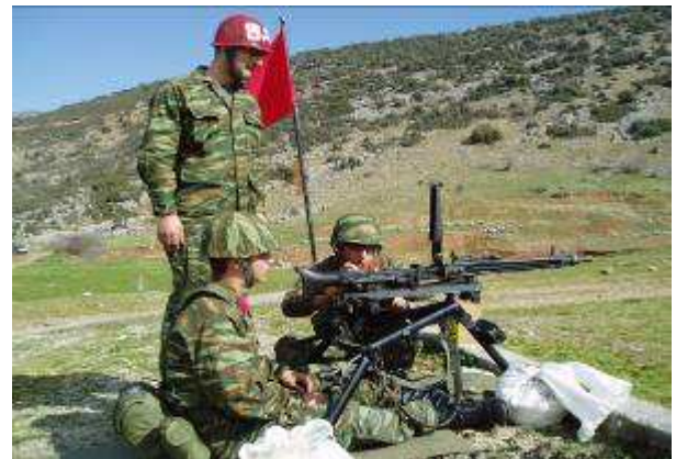
Εικ.33: Βολή Πολυβολου MG 3