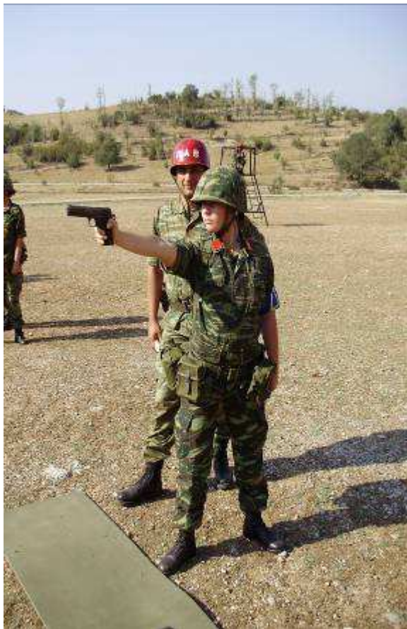
Εικ.32: Βολή Πιστολίου

Ειδικότερα αποσκοπεί στην ομαλή προσαρμογή των Σπουδαστών στη στρατιωτική ζωή, την αύξηση της φυσικής αντοχής και της σωματικής ενδυνάμωσης, την εκμάθηση χειρισμού ατομικού οπλισμού και εκτέλεση βολών με ελαφρά και βαρέα όπλα στην συμμετοχή σε πορείες, ασκήσεις κλπ.