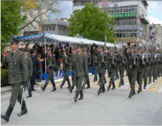
Εικ.96: Παρέλαση σε Εθνικές Εορτές

Οι Σπουδαστές της Σχολής συμμετέχουν σε διάφορες πολιτιστικές εκδηλώσεις που πραγματοποιούνται στην πόλη των Τρικάλων όπως θεατρικές παραστάσεις, διάφορες εκθέσεις, συναυλίες κλπ. Επίσης η Σχολή συμμετέχει σε παρελάσεις στις πόλεις των Τρικάλων, Λάρισας, Αθηνών και Θεσσαλονίκης.