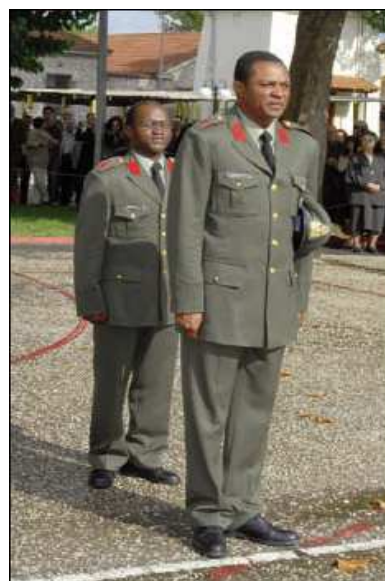
Εικ. 17: Αλλοδαποι Σπουδαστές