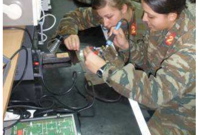
Εικ.25: Εργαστήριο Ηλεκτρονικών