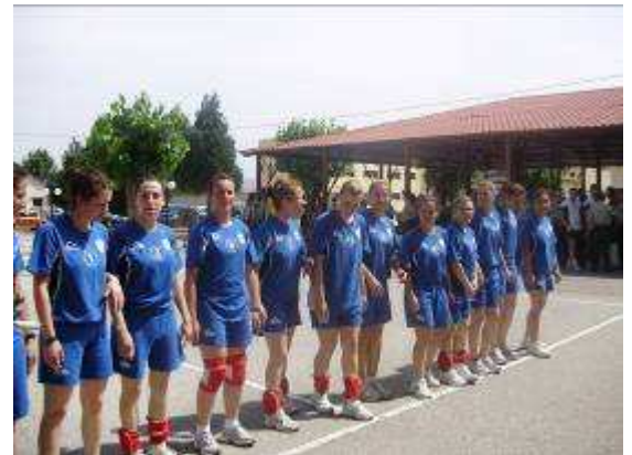
Εικ. 42: Ομάδα Πετοσφαίρισης