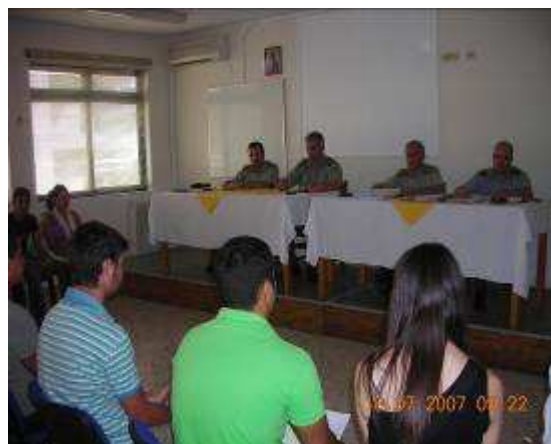
Εικ.7: Ψυχοτεχνική Δοκιμασία