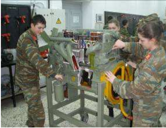
Εικ.26: Εργαστήριο Μηχανών Ε/Π