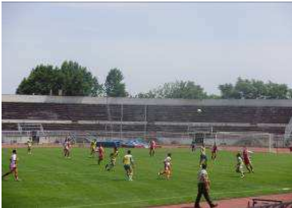
Εικ. 41: Ομάδα Ποδοσφαίρου

Εκτός από τη γενική υποχρεωτική άθληση ο κάθε Σπουδαστής ανάλογα με τις ατομικές του επιδόσεις συμμετέχει και στις ομάδες Ποδοσφαίρου, Πετόσφαιρας, Καλαθόσφαιρας, Χειροσφαίρισης, Κλασικού αθλητισμού, Πολεμικών τεχνών, Κολύμβησης και Παραδοσιακών χορών.