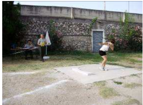
Εικ. 13 : Αθλητική δοκιμασία - Σφαίρα.

Τα κριτήρια εισαγωγής των υποψηφίων (Ανδρών - Γυναικών) είναι τα ίδια εκτός από τα παρακάτω :