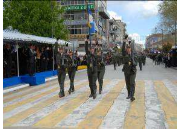
Εικ.97: Παρέλαση σε Εθνικές Εορτές