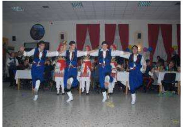
Εικ.46: Ομάδα Παραδοσιακών Χορών

Οι αντιπροσωπευτικές ομάδες της Σχολής αγωνίζονται με τις αντίστοιχες ομάδες των Ανωτέρων Στρατιωτικών Σχολών Υπαξιωματικών(ΑΣΣΥ) του Ναυτικού, της Αεροπορίας και της Αστυνομίας στα πλαίσια των αγώνων των Ενόπλων Δυνάμεων και Σωμάτων Ασφαλείας που διοργανώνει το ΑΣΑΕΔ.