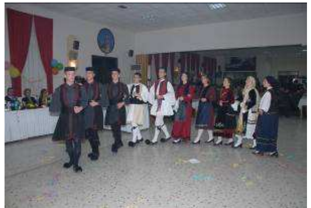
Εικ.59: Παραδοσιακοί Χοροί