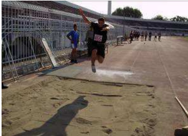
Εικ. 12: Αθλητική Δοκιμασία-Άλμασε μήκος