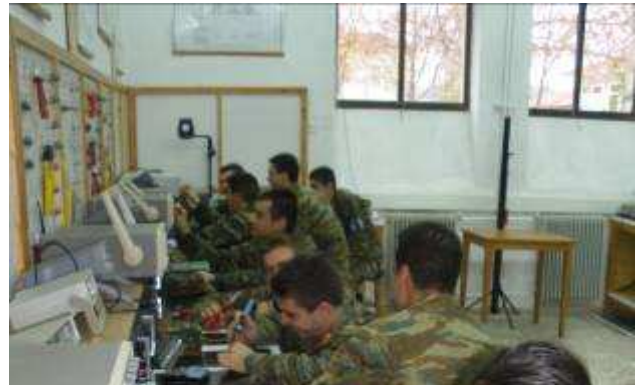
Εικ.22: Εργαστήριο Ηλεκτρονικών