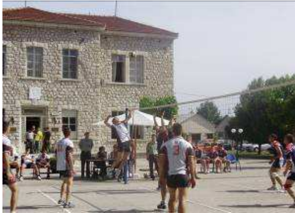
Εικ.56: Αγώνας Πετοσφαίρισης.