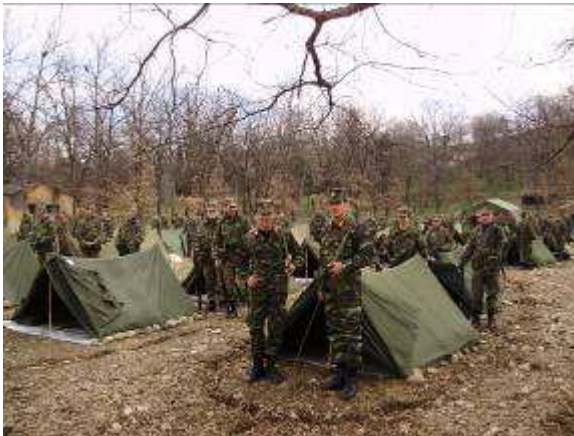
Εικ.36: Χειμερινή Διαβίωση σε Καταυλισμό