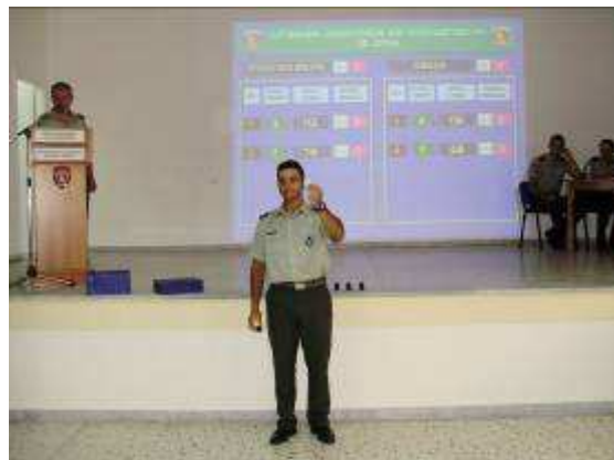
Εικ. 15: Διαδικασία Κατανομής

Τέλος, στην Σχολή εισάγεται και εκπαιδεύεται αριθμός Ελληνοκυπρίων Σπουδαστών καθώς και αλλοδαπών κατόπιν διακρατικών συμφωνιών.