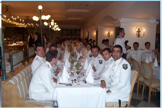
Συμμετοχή σε κοινωνικές εκδηλώσεις

Για την ψυχαγωγία τους οργανώνονται χορευτικές συγκεντρώσεις, χοροεσπερίδες, θεατρικές και κινηματογραφικές παραστάσεις, συναυλίες, αθλητικοί αγώνες και διαλέξεις εντός ή εκτός της Σχολής.