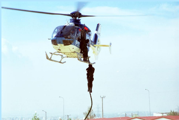
Εκπαίδευση Ειδικών Μονάδων