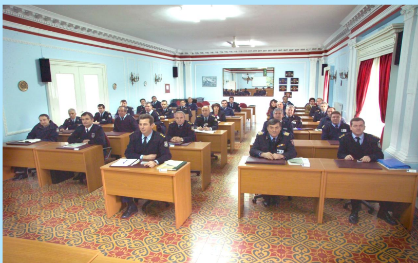
Αίθουσα Σχολής Εθνικής Ασφάλειας

Με βάση τα ανωτέρω και σύμφωνα με τις σύγχρονες αντιλήψεις της «δια βίου» εκπαίδευσης και μετεκπαίδευσης του προσωπικού της Ελληνικής Αστυνομίας, ιδρύθηκαν και λειτουργούν οι εξής Σχολές: