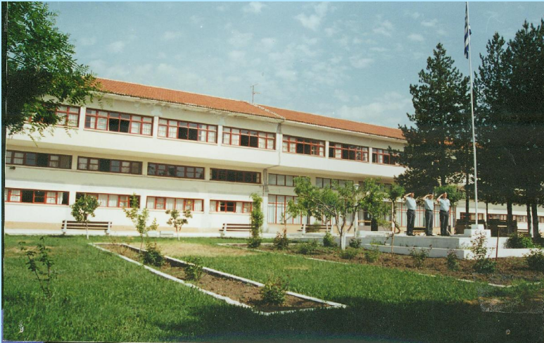
Κτιριακές εγκαταστάσεις Τμήματος Δοκίμων Αστυφυλάκων Γρεβενών

Υποψήφιοι που κρίθηκαν ΜΗ ΙΚΑΝΟΙ για τις Αστυνομικές Σχολές, από τις αρμόδιες Επιτροπές των προκαταρκτικών εξετάσεων της Ελληνικής Αστυνομίας, δεν μπορούν να προσκομίσουν βεβαίωση Στρατιωτικής Σχολής.