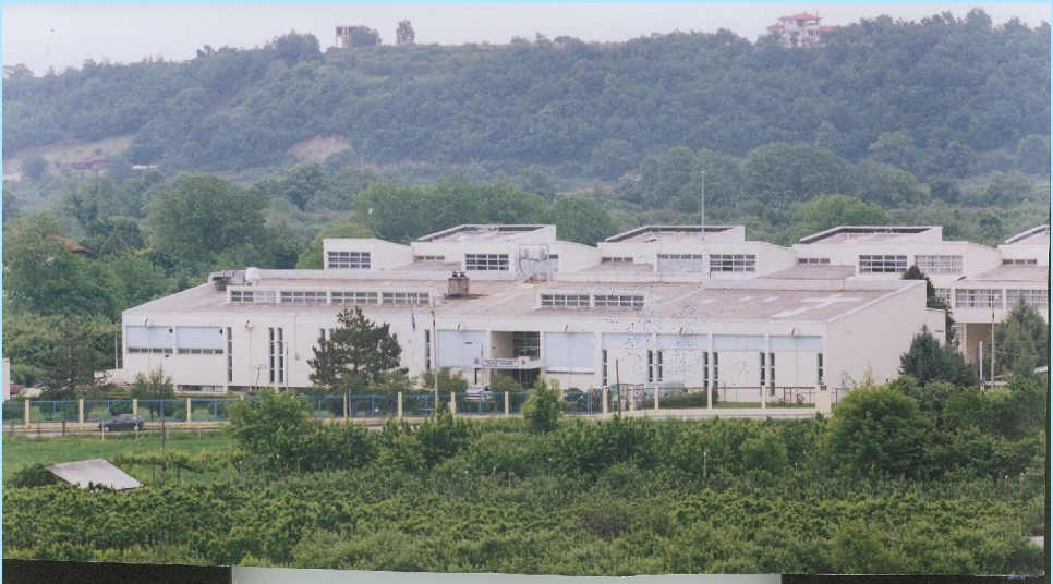
Κτιριακές εγκαταστάσεις Τμήματος Δοκίμων Αστυφυλάκων Νάουσας