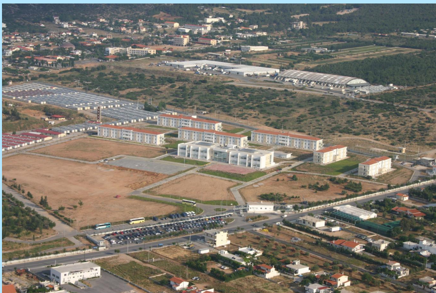
Πανοραμική άποψη των κτιριακών εγκαταστάσεων της Σχολής Αξιωματικών

Η Σχολή Αξιωματικών της Ελληνικής Αστυνομίας είναι ισότιμη με τις Σχολές των Πανεπιστημιακών Ιδρυμάτων και τις αντίστοιχες παραγωγικές Σχολές των Ενόπλων Δυνάμεων.