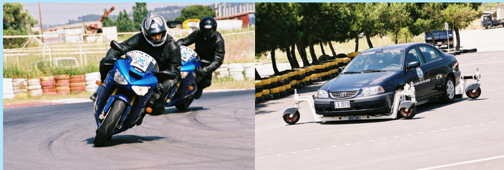
Εκμάθηση οδήγησης δικύκλου-αυτοκινήτου