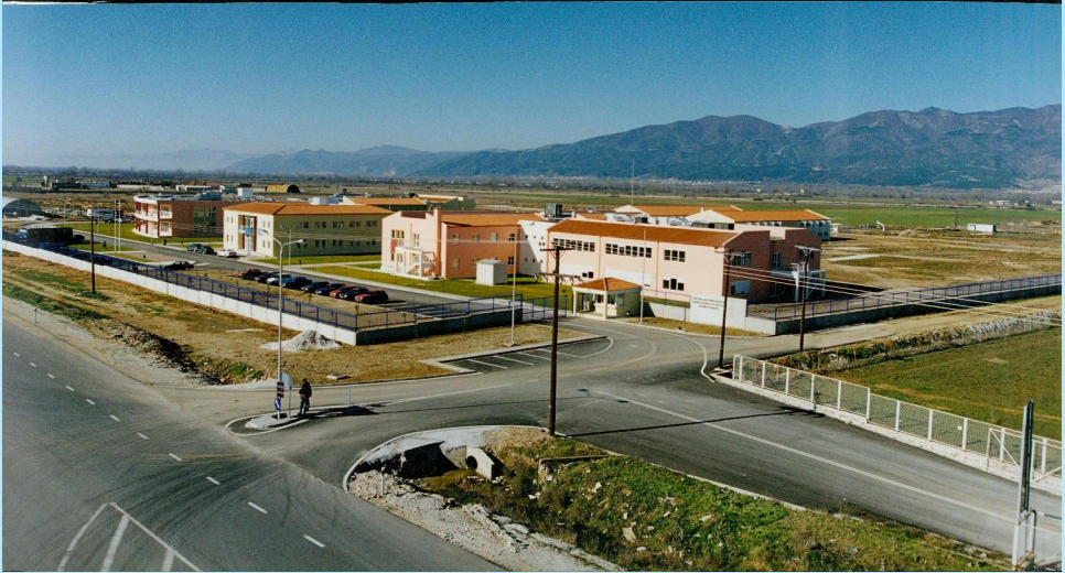
Κτιριακές εγκαταστάσεις Τμήματος, Δοκίμων Αστυφυλάκων Κομοτηνής

9. Να μην τελούν υπό απαγόρευση ή δικαστική αντίληψη.