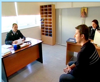
Πρότυπο Αστυνομικό Τμήμα