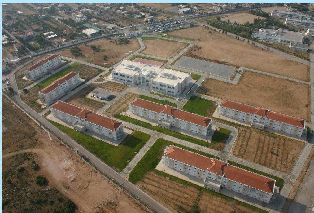
Πανοραμική άποψη συγκροτήματος Σχολών της Αστυνομικής Ακαδημίας στην Αμυγδαλέζα Αττικής