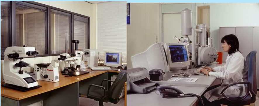
Επιστημονική έρευνα του εγκλήματος

Οι νεοεξερχόμενοι Υπαστυνόμοι και Αστυφύλακες, τοποθετούνται και εκτελούν υπηρεσία σε όλες τις Υπηρεσίες της Ελληνικής Αστυνομίας. Μετά τη συμπλήρωση τριών (3) ετών υπηρεσίας στην ίδια περιοχή έχουν δικαίωμα υποβολής αίτησης μετάθεσης για υπηρεσίες άλλης περιοχής. Οι μεταθέσεις των αστυνομικών αποφασίζονται από τα αρμόδια υπηρεσιακά Συμβούλια με βάση καθορισμένα από τους κανονισμούς της Ελληνικής Αστυνομίας αντικειμενικά κριτήρια.