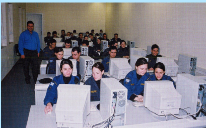
Αίθουσα διδασκαλίας πληροφορικής