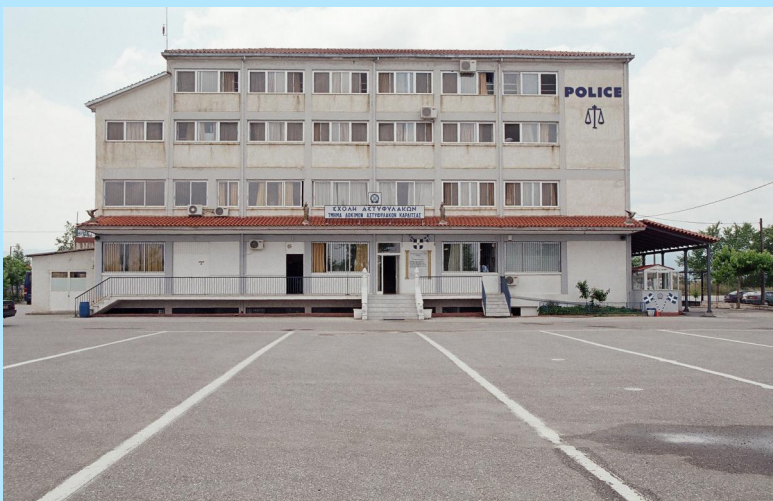
Κτιριακές εγκαταστάσεις Τμήματος Δοκίμων Αστυφυλάκων Καρδίτσας