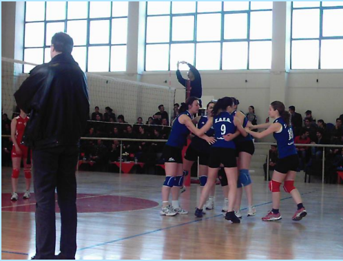
Συμμετοχή σε αθλητικούς αγώνες