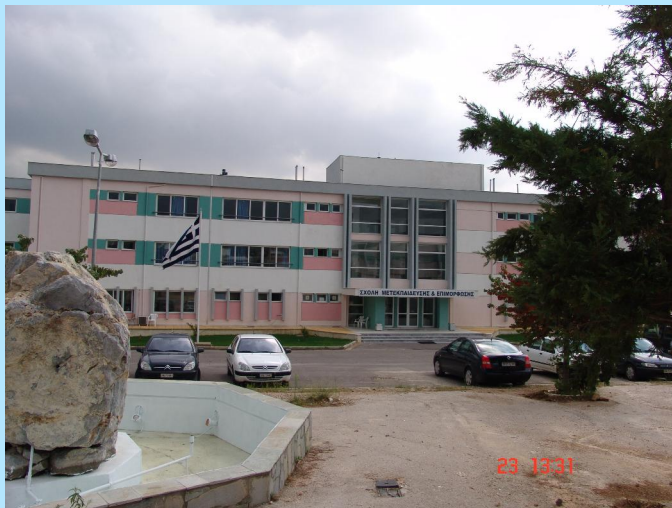
Κτιριακές εγκαταστάσεις Σχολής Μετεκπαίδευσης και Επιμόρφωσης

Διδακτικό προσωπικό: Πανεπιστημιακοί καθηγητές, Ανώτατοι και Ανώτεροι Αξιωματικοί της Ελληνικής Αστυνομίας, Στελέχη της Δημόσιας Διοίκησης, Στελέχη των Ανεξάρτητων Αρχών, Πολιτικές προσωπικότητες, Στελέχη Μ.Κ.Ο., Δικαστικοί Λειτουργοί.