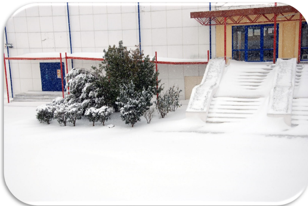
Εξωτερικός Χώρος της Σχολής

Εξυπηρετεί τις εκπαιδευτικές και ερευνητικές ανάγκες στο γνωστικό αντικείμενο της χημείας, των χημικών προϊόντων του ξύλου, της τεχνολογίας του ξύλου, των προϊόντων του, της λειτουργίας των δασικών βιομηχανιών. Της δασικής ενέργειας.