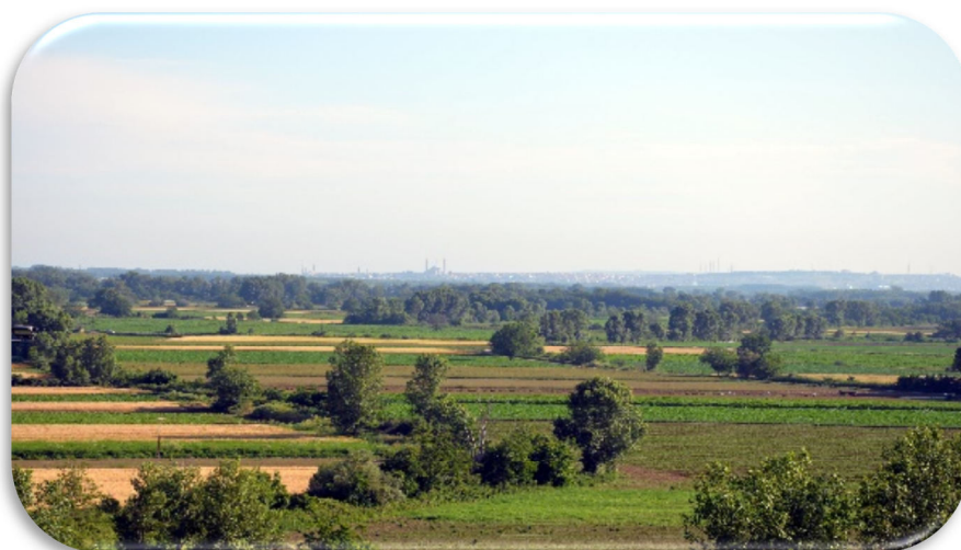
Η περιοχή των Καστανεών και στο βάθος η Ανδριανούπολη

Η περιοχή της Νέας Ορεστιάδας είναι μία από τις εύφορες και παραγωγικές περιοχές της Ελλάδας με ύπαιθρο που διακρίνεται για την ομορφιά και τον πλούτο της