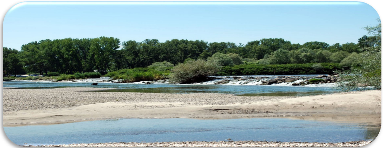
Ο ποταμός Άρδας

Στην Θράκη βρίσκονται σημαντικοί αρχαιολογικοί χώροι όπως: Άβδηρα, Μαρώνεια, Μεσημβρία, Σαμοθράκη Μικρή Δοξιάρα, καθώς και εξαιρετικής σημασίας υδροβιότοποι, όπως το Δέλτα των ποταμών Νέστου και Έβρου και η λιμνοθάλασσα της Βιστωνίδας, οι οποίοι προστατεύονται από διεθνείς συνθήκες και οργανισμούς.