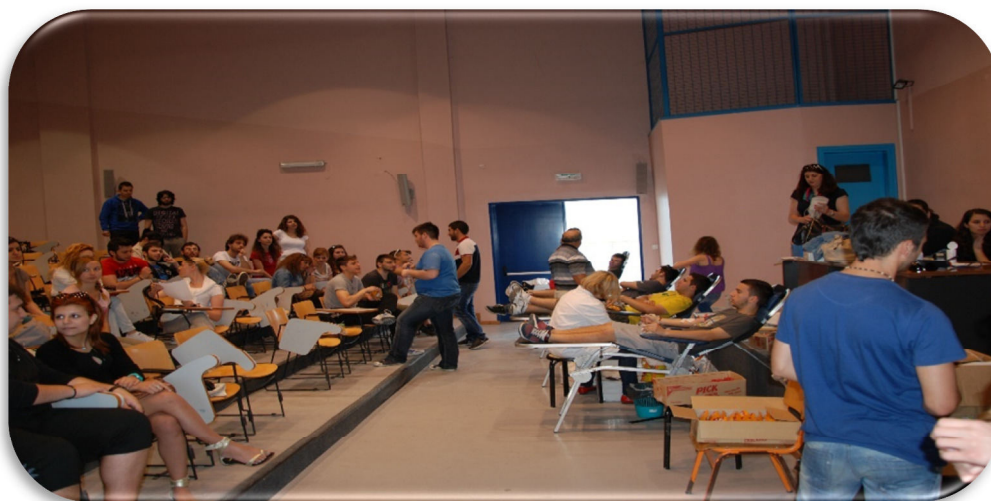
Εθελοντική Αιμοδοσία στο Αμφιθέατρο της Σχολής

Τα δύο Τμήματα που εδρεύουν στην Ορεστιάδα, το Τμήμα Δασολογίας & Διαχείρισης Περιβάλλοντος & Φυσικών Πόρων και το Τμήμα Αγροτικής Ανάπτυξης στεγάζονται σε τρία κτίρια που έχουν συνολικό εμβαδόν εγκαταστάσεων 5.486 τετραγωνικά μέτρα. Αναλυτικότερα: το Κεντρικό κτίριο με εμβαδόν 2.826 τετραγωνικά μέτρα, το κτίριο των αμφιθεάτρων με 791 τετραγωνικά μέτρα, το κτίριο των Εργαστηρίων με 1.800 τετραγωνικά μέτρα και το κυλικείο με 69 τετραγωνικά μέτρα. Η τοποθεσία του Πανεπιστημίου βρίσκεται μέσα στην πόλη της Ορεστιάδας.