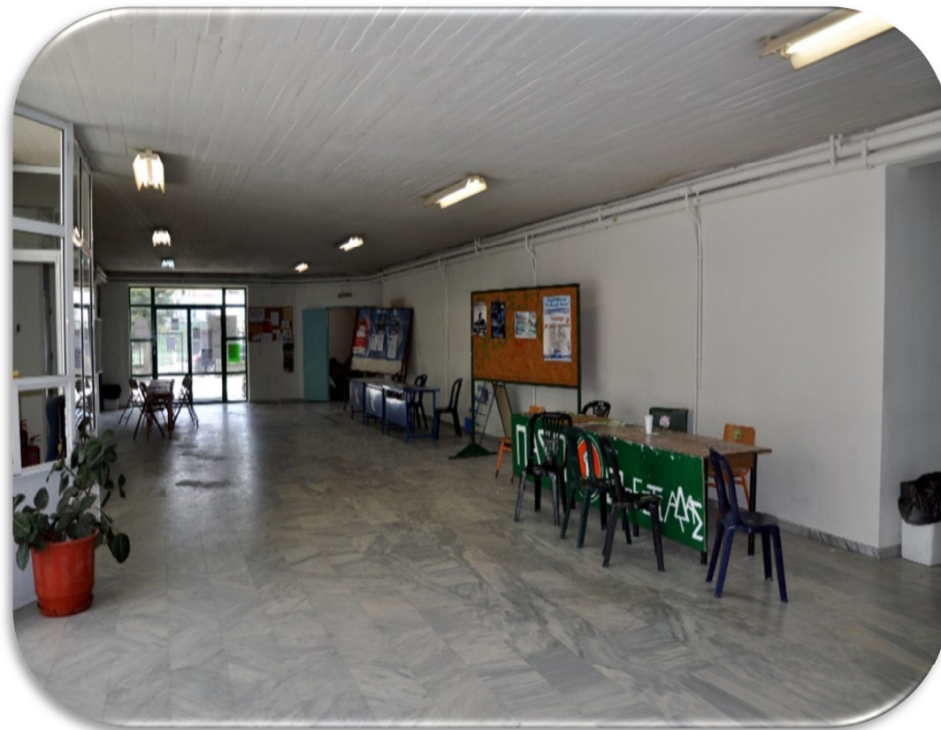
Εσωτερικός Χώρος για τις Δραστηριότητες των Φοιτητών

Η ταχυδρομική διεύθυνση του Τμήματος είναι: ΔΗΜΟΚΡΙΤΕΙΟ ΠΑΝΕΠΙΣΤΗΜΙΟ ΘΡΑΚΗΣ ΣΧΟΛΗ ΕΠΙΣΤΗΜΩΝ ΓΕΩΠΟΝΙΑΣ ΚΑΙ ΔΑΣΟΛΟΓΙΑΣ ΤΜΗΜΑ ΔΑΣΟΛΟΓΙΑΣ ΚΑΙ ΔΙΑΧΕΙΡΙΣΗΣ ΠΕΡΙΒΑΛΛΟΝΤΟΣ ΚΑΙ ΦΥΣΙΚΩΝ ΠΟΡΩΝ ΑΘ. ΠΑΝΤΑΖΙΔΟΥ 193 68200 ΟΡΕΣΤΙΑΔΑ Τηλέφωνα Γραμματείας: (25520) 41171-2-3-4 Fax Γραμματείας: (25520) 411