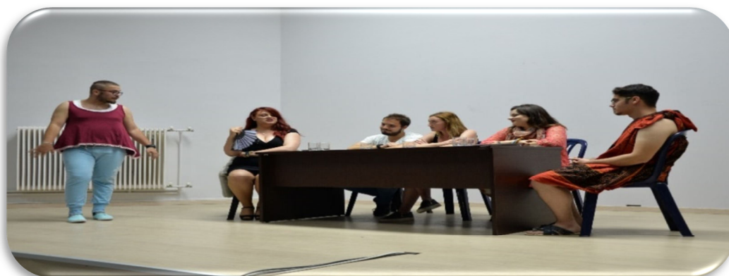
Θεατρική Παράσταση στην Αίθουσα Τελετών

Στην κτιριακή υποδομή περιλαμβάνονται μία Αίθουσα Τελετών 200 θέσεων, τέσσερις Αίθουσες Διδασκαλίας 50 θέσεων η κάθε μία και δύο Αμφιθέατρα 150 θέσεων το κάθε ένα. Η Εργαστηριακή υποδομή περιλαμβάνει τρεις Εργαστηριακές Αίθουσες και ένα Σχεδιαστήριο με σύγχρονη υλικοτεχνική υποδομή. Τα εργαστήρια έχουν οργανωθεί σε πολυεργαστήρια όπου συστεγάζονται συγγενή γνωστικά αντικείμενα. Επίσης λειτουργεί σύγχρονο εργαστήριο Ηλεκτρονικών Υπολογιστών. Στην υποδομή αυτή εντάχθηκε το 2003 το κτίριο των εργαστηρίων που περιλαμβάνει 9 εργαστήρια με βοηθητικούς χώρους και 25 γραφεία. Ακόμη, λειτουργούν πλήρως ένα Αναγνωστήριο και μία Αίθουσα Ηλεκτρονικών Υπολογιστών για την διευκόλυνση της μελέτης των Φοιτητών καθώς επίσης και σύγχρονη Βιβλιοθήκη που αριθμεί 8.500 βιβλία και συνεχώς εμπλουτίζεται.