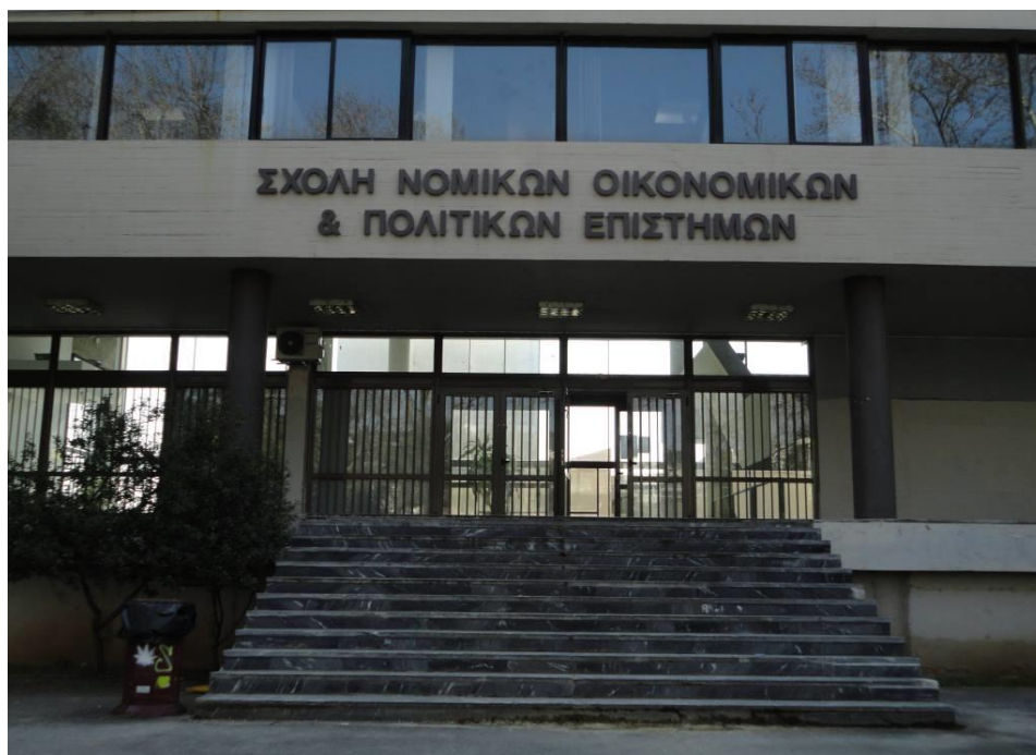
Τμήμα Πολιτικών Επιστημών, κτίριο Νομικής Σχολής και Σχολής Ο.Π.Ε., Πανεπιστημιούπολη

Αργότερα, με το Νόμο 1268/1982 «Για τη δομή και λειτουργία των ΑΕΙ» και τις τροποποιήσεις του, η Σχολή χωρίστηκε σε δύο αυτοτελή Τμήματα, το Τμήμα Νομικής και το Τμήμα Οικονομικών Επιστημών. Τέλος, το 1999, με το Π.Δ. 203/99, ιδρύθηκε το Τμήμα Πολιτικών Επιστημών, το οποίο προστέθηκε στα ήδη υφιστάμενα Τμήματα. Μετά την ίδρυση του νέου Τμήματος, η Σχολή μετονομάστηκε σε Σχολή Νομικών, Οικονομικών και Πολιτικών Επιστημών (ΝΟΠΕ) (Π.Δ. 87/2001, Φ.Ε.Κ. 86/20-4-2001).