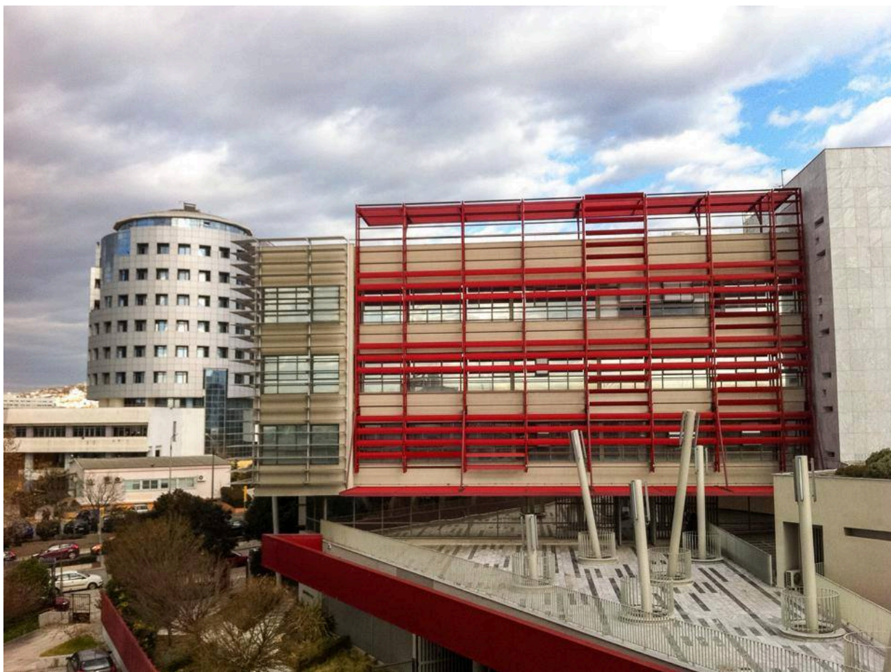
Ο «πύργος» της Παιδαγωγικής Σχολής και το συνεδριακό κέντρο του ΑΠΘ (Κέντρο Διάδοσης Ερευνητικών Αποτελεσμάτων)