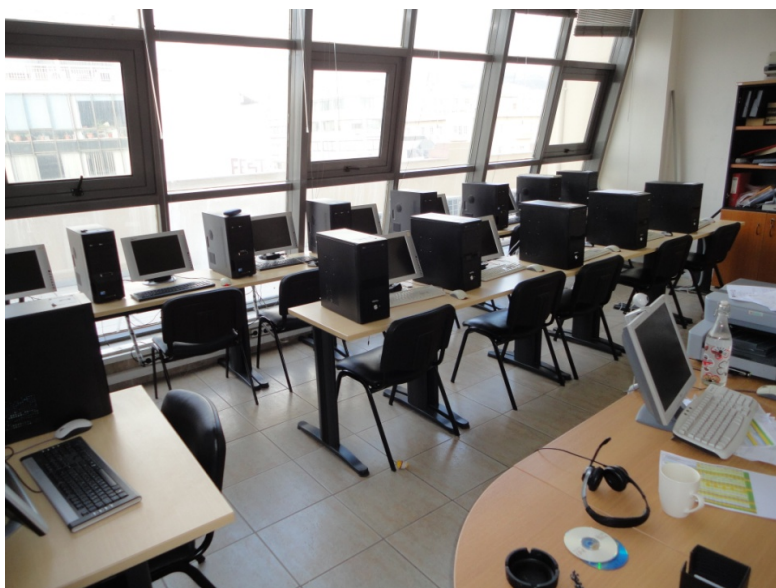
Εργαστήριο Τμήματος Πολιτικών Επιστημών, Εγνατίας 46