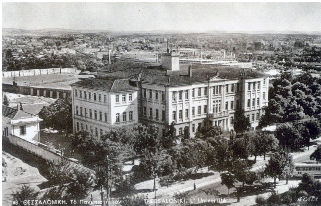
Η «παλιά» Φιλοσοφική, πρώτο κτίριο του Πανεπιστημίου Θεσσαλονίκης στο χώρο της μετέπειτα Πανεπιστημιούπολης