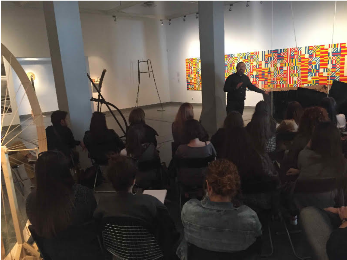
Επίσκεψη φοιτητών/τριών στο Κέντρο Σύγχρονης Τέχνης Θεσσαλονίκης