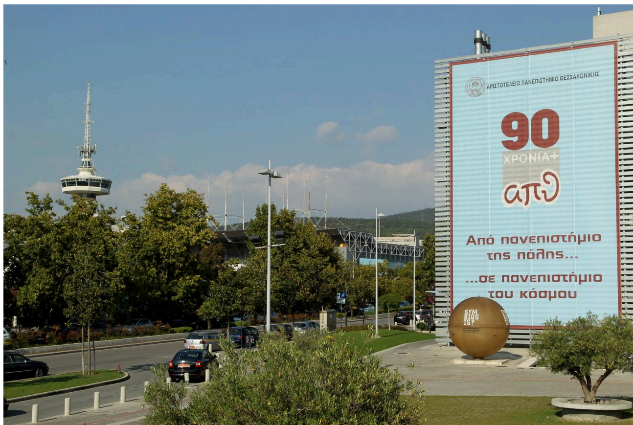
1926-2016: 90 χρόνια ΑΠΘ