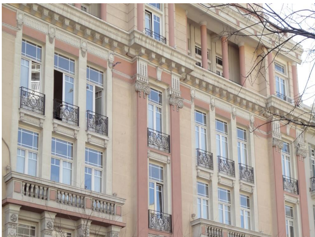
Τμήμα Πολιτικών Επιστημών, Εγνατίας 46