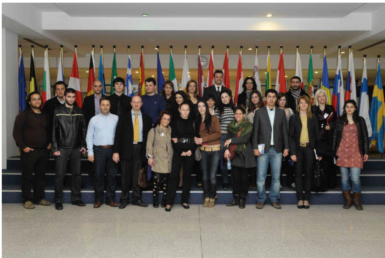
Επισκέψεις φοιτητών/τριών του Τμήματος στους ευρωπαϊκούς θεσμούς