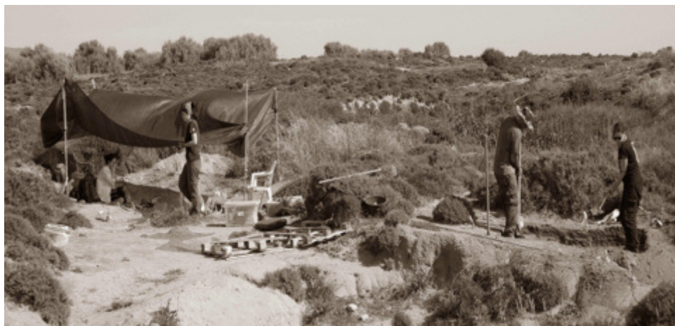
Η ανασκαφή της Παλαιολιθικής εγκατάστασης του 'Ούριακου' στη Λήμνο (11η χιλ. π.Χ.)