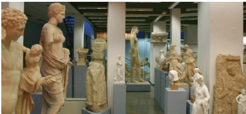
Μουσείο Εκμαγείων. Άποψη της αίθουσας Κ. Ρωμαίου

7.000 φωτογραφίες, εξυπηρετούν τομείς της έρευνας μεταπτυχιακών φοιτητών, υποψήφιων διδασκάλων και ερευνητών, αλλά και δράσεις των φοιτητών του Τμήματος στο πλαίσιο της πρακτικής τους άσκησης. Η λειτουργία και οι δραστηριότητες του Μουσείου στους εκθεσιακούς χώρους και το μικρό του αμφιθέατρο έχουν σκοπό κυρίως ερευνητικό και εκπαιδευτικό με την οργάνωση ξεναγήσεων για φοιτητές. Ταυτόχρονα, όμως, απευθύνονται και στο ευρύτερο κοινό με την πραγματοποίηση εκπαιδευτικών προγραμμάτων για μαθητές της πρωτοβάθμιας και Δευτεροβάθμιας Εκπαίδευσης, αλλά και ξεναγήσεων για το ενήλικο κοινό.