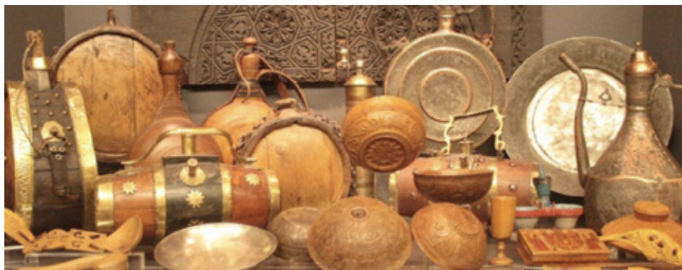
Παραδοσιακά σκεύη από τις συλλογές του Λαογραφικού Μουσείου

φικής και γλυπτικής, φιγούρες του θεάτρου σκιών), αλλά και αντικείμενα και έπιπλα που σχετίζονται με την ιστορία του συγκεκριμένου Μουσείου και με την ιστορία του ΑΠΘ, ενώ στο Σπουδαστήριο Λαογραφίας και Κοινωνικής Ανθρωπολογίας εκτίθεται και μια μικρή συλλογή μουσικών οργάνων. Το Μουσείο είναι ανοικτό στο κοινό, τους σπουδαστές και τους ερευνητές.