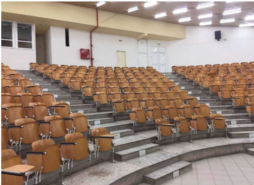
Άποψη του κεντρικού αμφιθεάτρου