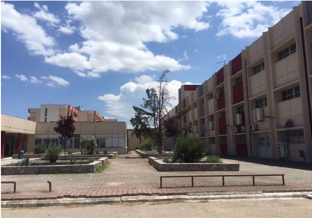
Άποψη της Πανεπιστημιούπολης του Εθνικού και Καποδιστριακού Πανεπιστημίου Αθηνών στα Ψαχνά Ευβοίας.