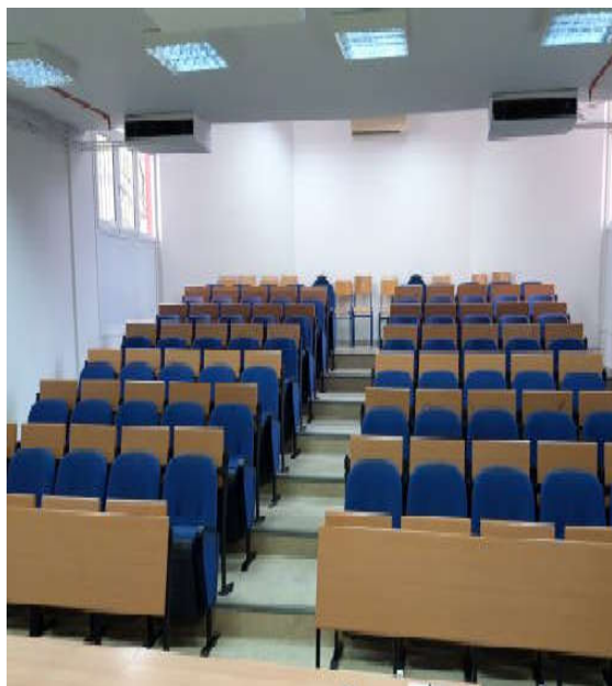
Άποψη αίθουσας διδασκαλίας