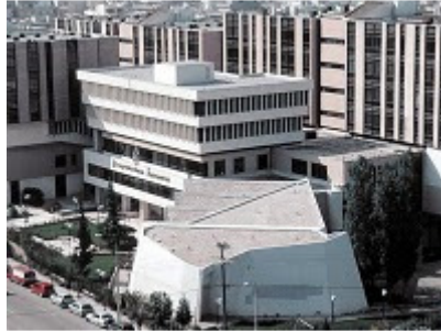
Το Πανεπιστήμιο Μακεδονίας (Πρώην ΑΒΣΘ)