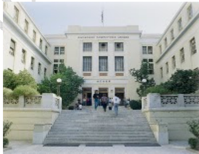
Το Οικονομικό Πανεπιστήμιο Αθηνών (πρώην ΑΣΟΕΕ)