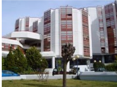
Το Πανεπιστήμιο Πειραιά (Πρώην ΑΒΣΠ)