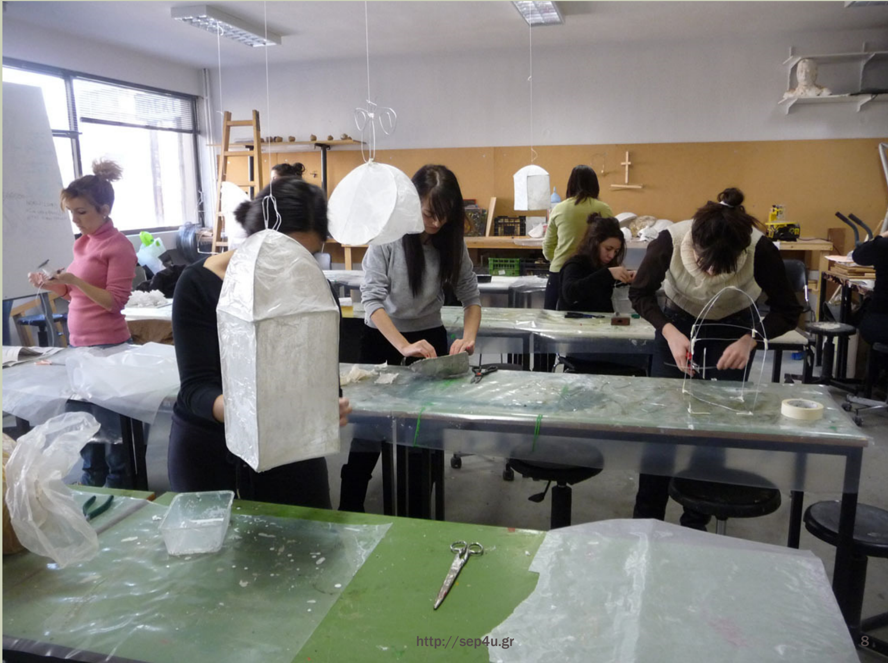
Το εργαστήριο γλυπτικής-κατασκευών (Καθολικών 4)